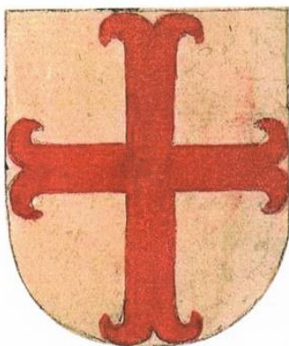
a. Van Oestgeest

Hoewel bij het geslacht Van Tetrode pas in de 14 e eeuw een zegel gedocumenteerd is, is het goed mogelijk dat de families Van Tetrode en Van Oegstgeest dezelfde oorsprong hebben. Ze kunnen daarom beide hetzelfde wapen gebruikt hebben, totdat Van Oegstgeest dit wapen liet vallen. Wellicht ook werd het wapen door het geslacht Van Tetrode geclaimd.