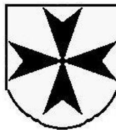
c. Duitse Orde